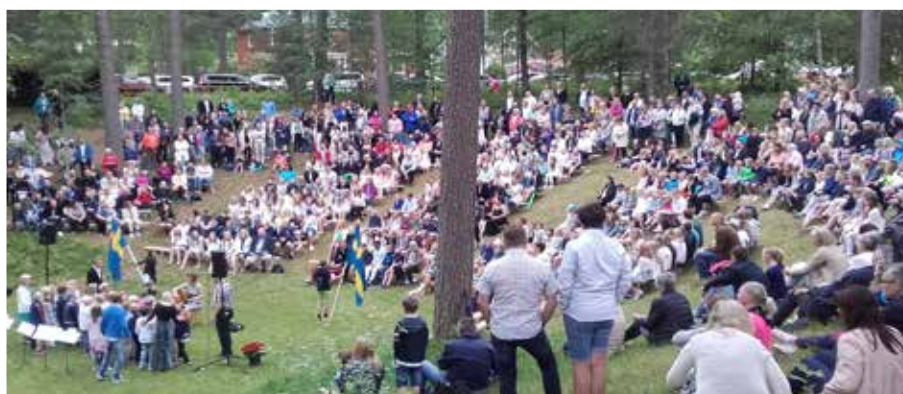
Tabergsskolan har haft skolavslutningar i Hembygdsparken under många år.