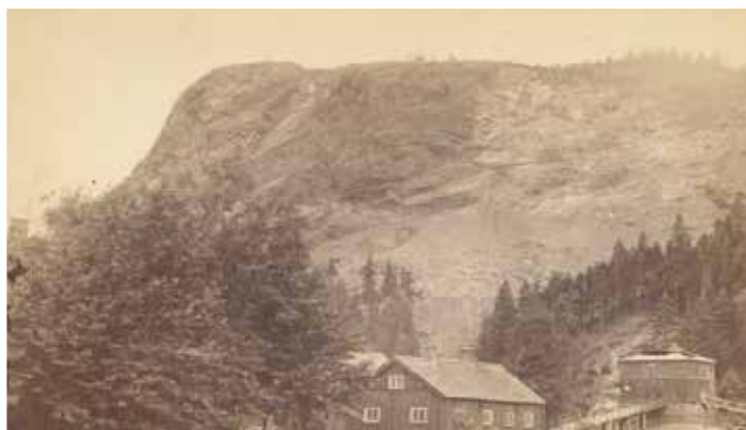
Kort taget i början av 1870-talet. Masugnen och hyttefogdestugan, som varit handelsbod och poststation.