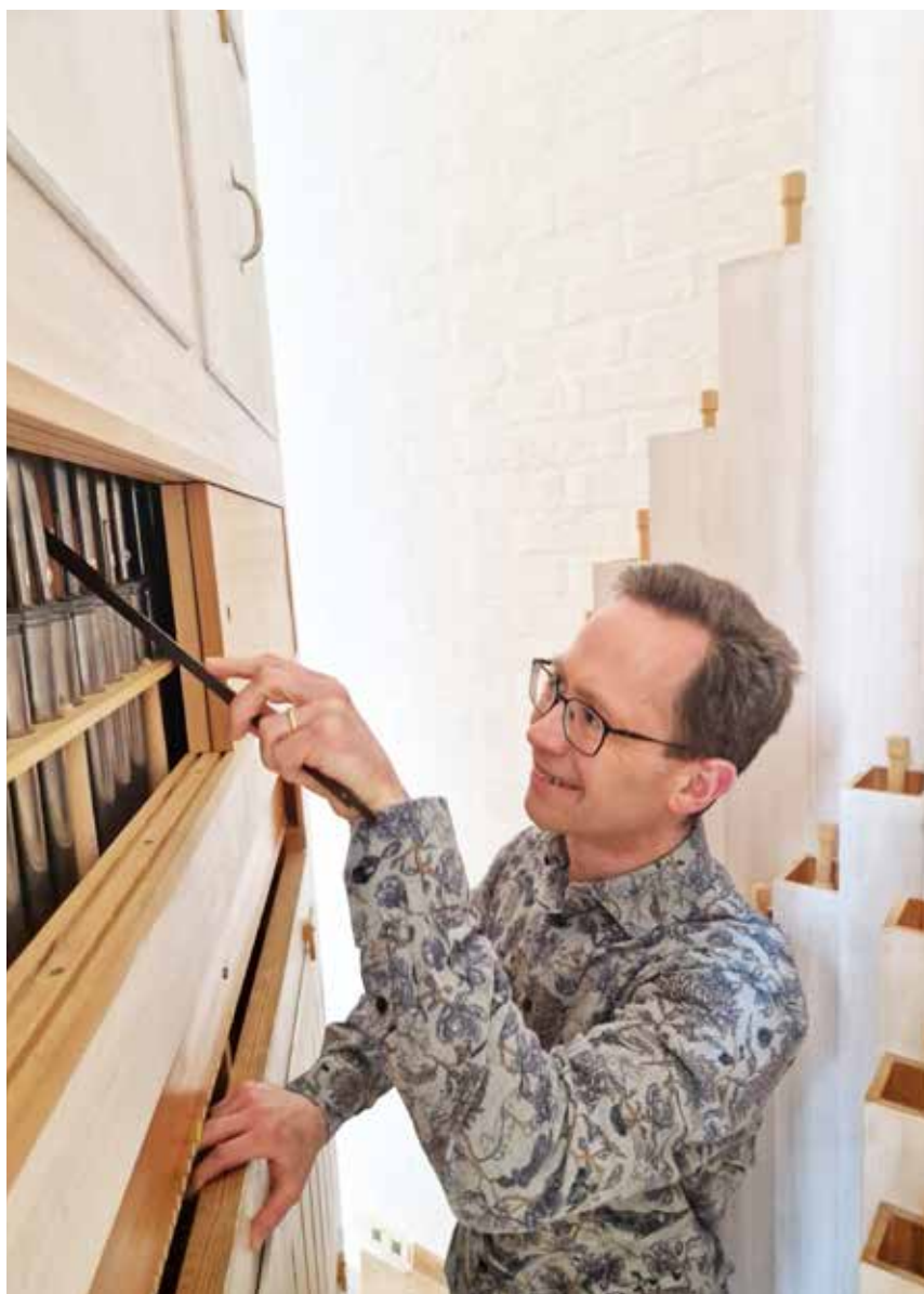
Stämning av rörverket på skolans kapellorgel

Piano- och orgelmetodik ingår i studierna dvs. att kunna lära ut konsten att spela. I dagsläget har han därför både en piano- och en orgelelev. Som kyrkomusiker ska du kunna arbeta med körer, spela orgel och piano samt hantera sång- och musiklivet generellt i församlingen.