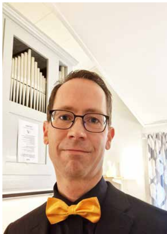
Lite trött men nöjd efter avklarat sångprov