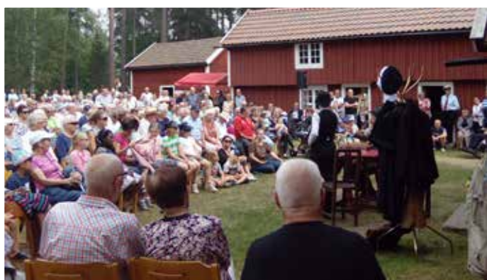
Teaterföreställning vid Hembygdsföreningens 90-årsjubileum